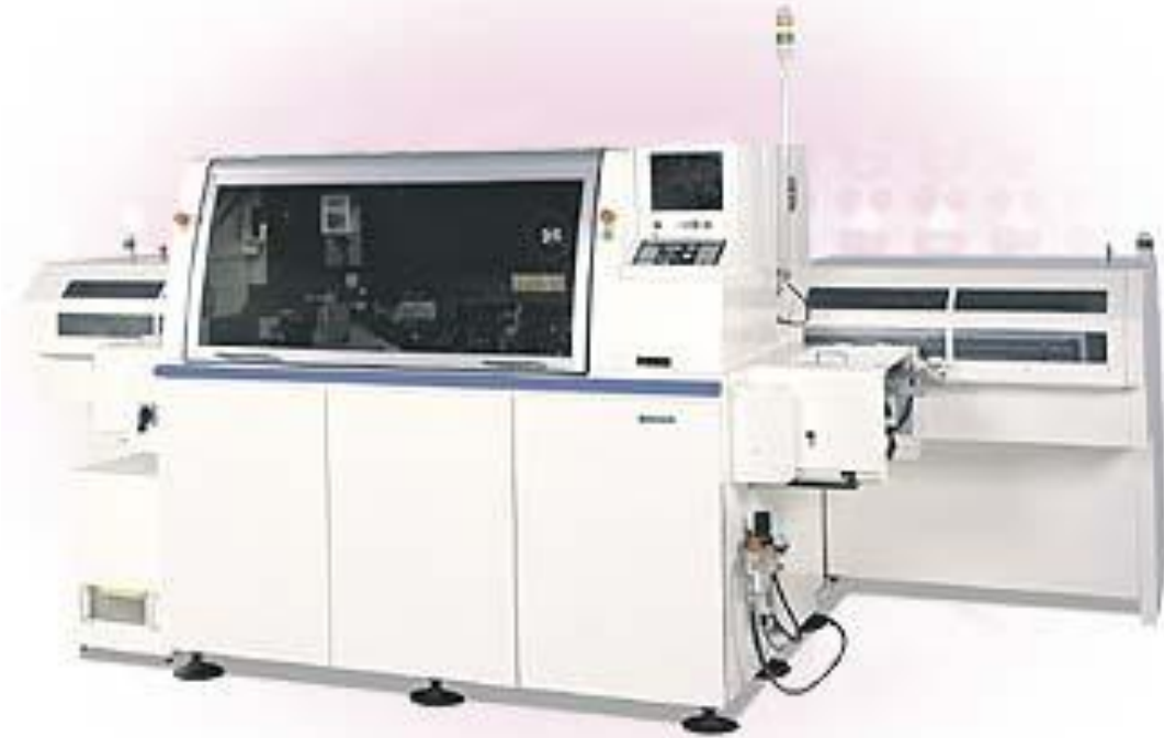
Machine Panasonic AVK2B