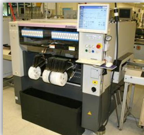
Machine Samsung Assembleon MG 1