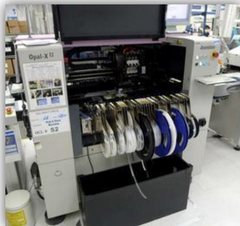
Machine Samsung Assembleon Opal XII